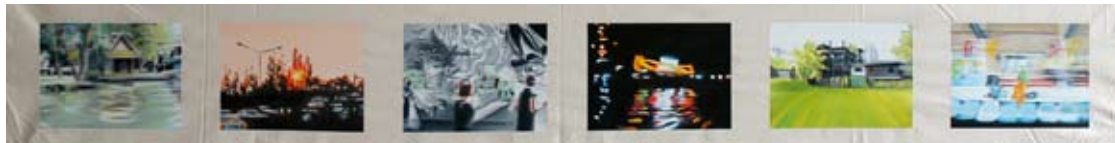
En route 2010 Huile sur toile 38 x 180 cm