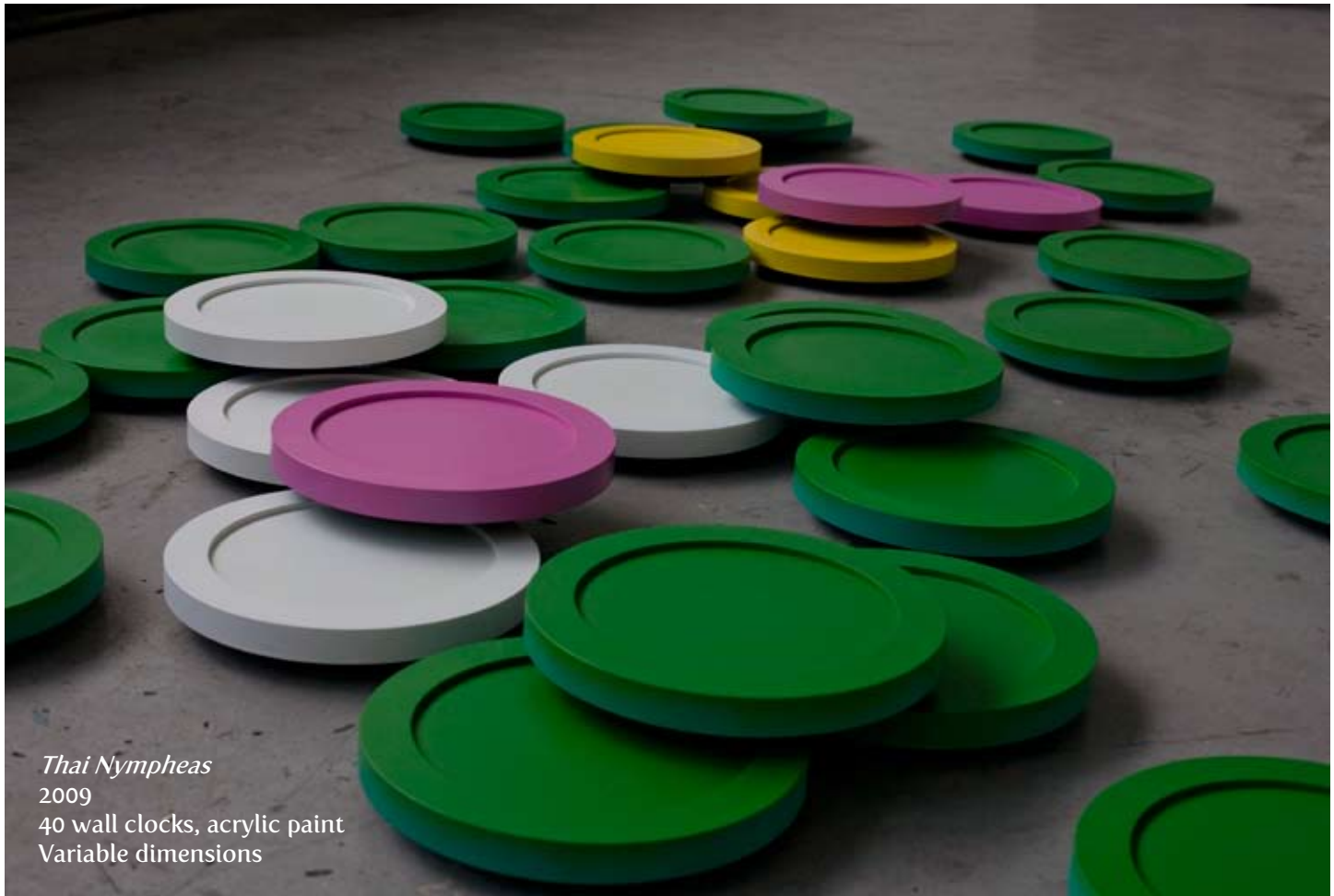
Thai Nymphs 2009 40 wall clocks, acrylic paint Variable dimensions