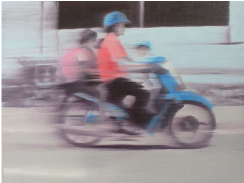
Sukhumvit-Road 2008 Huile sur toile 40 x 50 cm