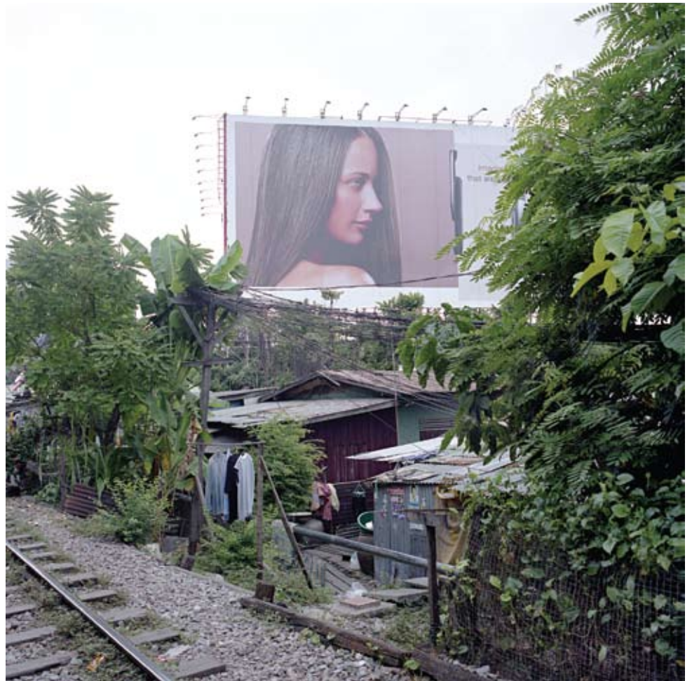
Bangkok 15/7/2007 Inkjet on Epson paper 100 x 100 cm Edition of 3